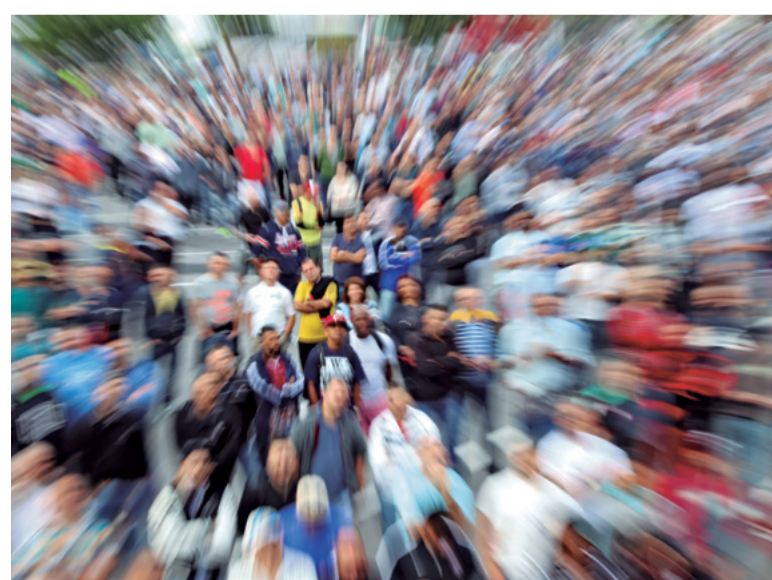
Dia 16: O Comitê informa aos metalúrgicos na Mercedes sobre a rejeição de duas propostas ainda na mesa de negociação no dia anterior por não atenderem a pauta