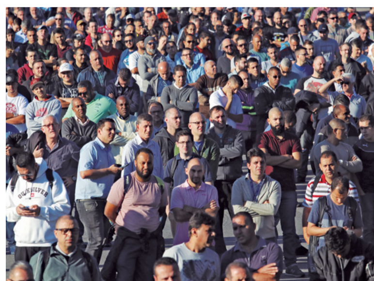
Dia 17: Conversas não avançam, sem nenhuma nova proposta, a greve entra no 4º dia. Os integrantes do CSE seguem pressionando para construção de entendimento

Os metalúrgicos na Mercedes ainda autorizaram a representação a abrir as discussões sobre o convênio médico e o banco. A pauta dos trabalhadores com os dois itens será entregue para a empresa nos próximos dias.