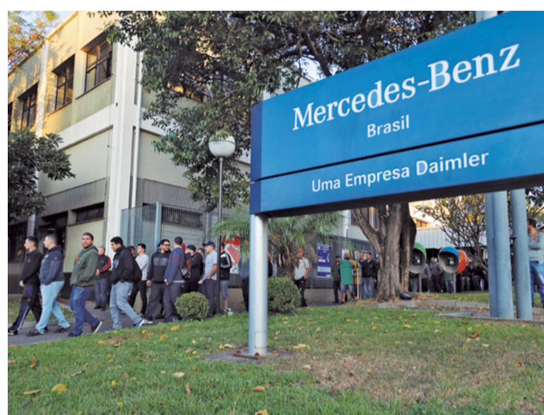
Dia 14: Companheiros aprovam a greve por tempo indeterminado e voltam para casa. A luta é por acordo coletivo, que reajuste salários e garanta as cláusulas sociais