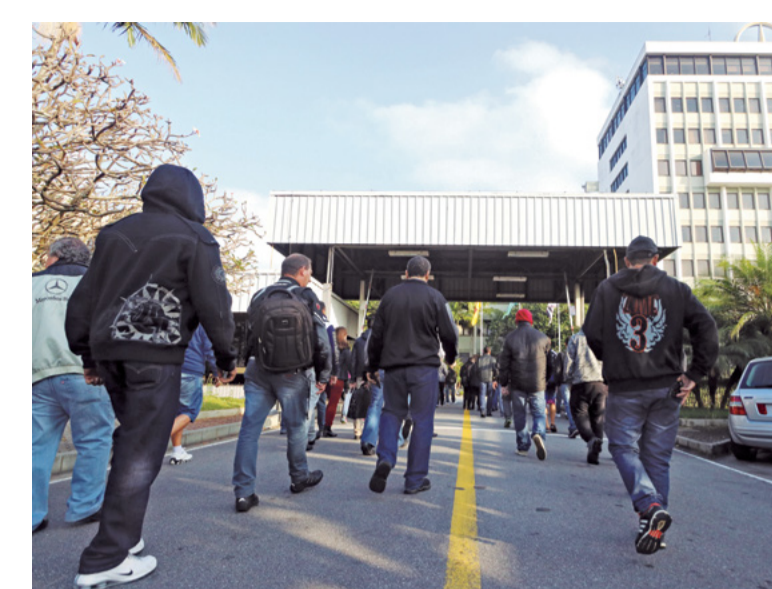
Dia 24: Vitória da organização dos trabalhadores e trabalhadoras. O acordo negociado pelo Sindicato é aprovado e os companheiros retornam ao trabalho. É o fim da greve