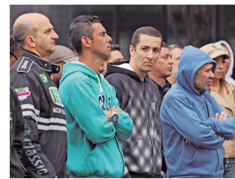
Dia 23: Trabalhadores reprovam a atitude da empresa de recorrer à justiça e pedem retomada das negociações. A disposição de luta da companheirada dá resultado