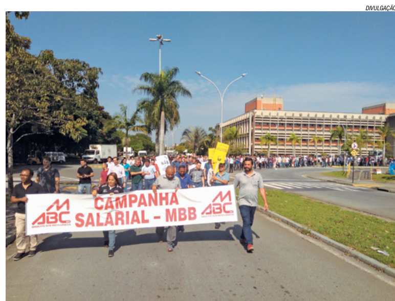
Dia 2: Início das mobilizações internas de campanha salarial com paradas e passeatas. Companheiros aprovam disposição de luta e greve, em assembleias nas áreas