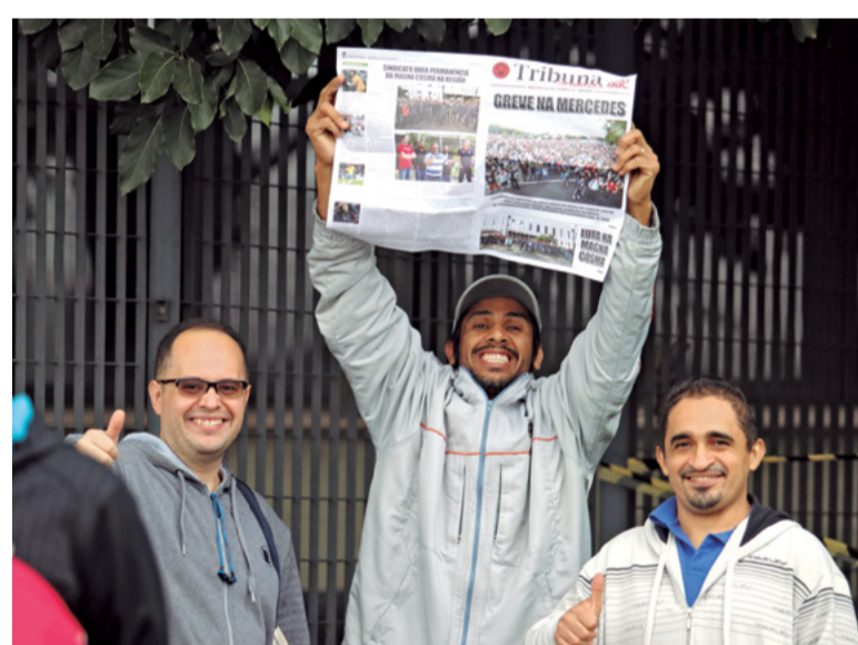
Dia 15: Sem proposta da Mercedes, trabalhadores decidem manter os braços cruzados. A unidade do movimento fortalece os representantes na mesa de negociações