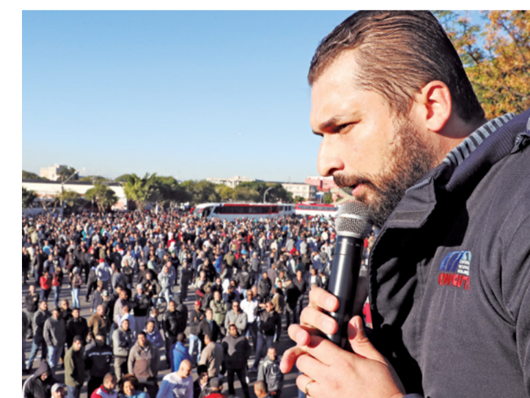
Dia 21: Durante todo o final de semana, os representantes tentam construir uma nova proposta, mas ainda encontram resistência da Mercedes. Greve entra no 6º dia