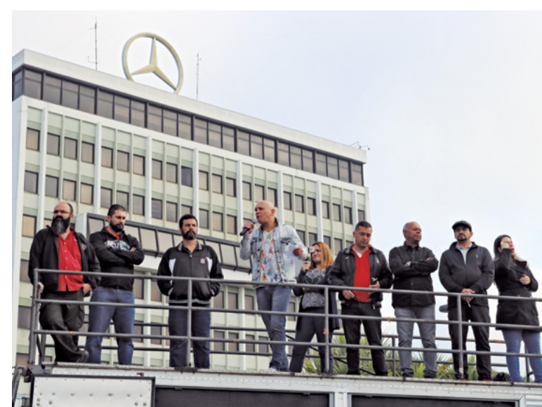
Dia 18: Metalúrgicos reprovam uma nova proposta da montadora, durante assembleia. Alguns pontos têm melhoras, mas os trabalhadores querem aumento real